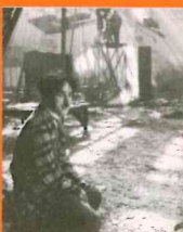
The Circus

altro restauro straordinario, A Dog's Life , che verrà proiettato insieme al capolavoro di Buster Keaton, Steamboat Bill Jr. , permettendoci di confrontare le somiglianze che si nascondono in queste opere. Quest'anno segnerà inoltre l'inizio dell'analisi di quel periodo della carriera di Chaplin che viene più spesso trascurato, ma che forse è proprio quello più rivoluzionario e inventivo: le pellicole prodotte alla Keystone a partire dal 1914. Ognuno di questi film rappresenta un contributo unico e nuovo al costituirsi del personaggio del Vagabondo.